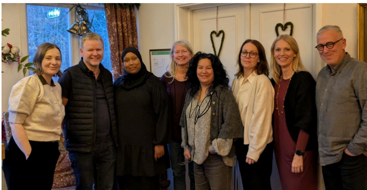
SPIVs utbildare träffades för att diskutera utveckling av utbildningarna.