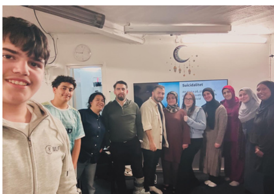
Lale kvinnoförening utbildades i Psykisk Livräddning.