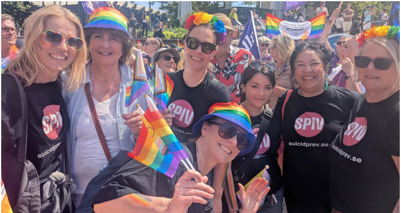
SPIV deltog i Pride-paraden i Göteborg 2025.