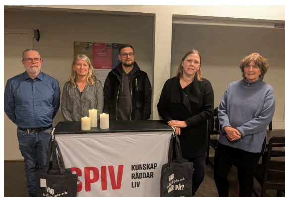
SPIVs nyvalda styrelse på årsmötet 2025.